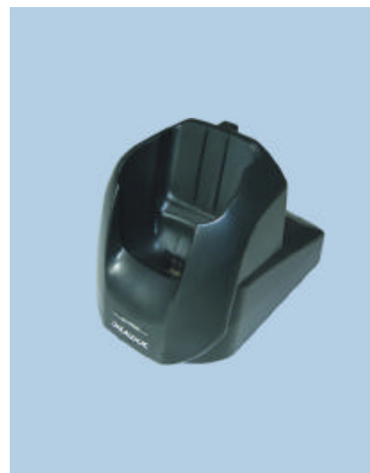
Culla singola (opzionale)