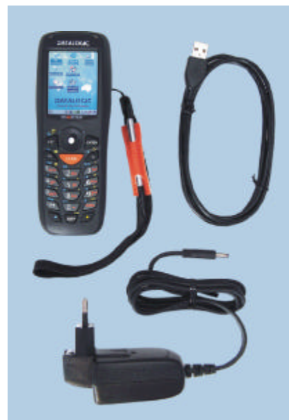
Contenuto del kit (standard)

Nota: Tutte le specifiche sono soggette a modifiche. Per le specifiche tecniche del prodotto far sempre riferimento al manuale in dotazione per l'utente