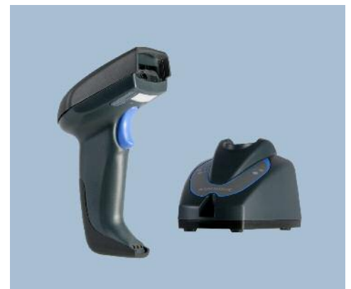
Letture QuickScan Mobile e culla