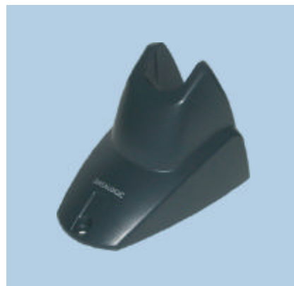
Supporto STD Heron™ "Hands-Free" con piastra metallica opzionale