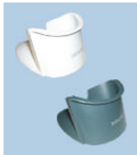
Supporto da tavolo e da muro