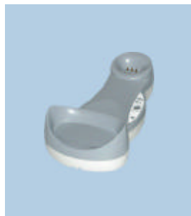
OM - Gryphon™