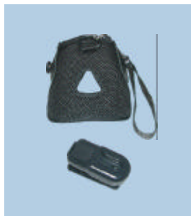
Custodia protettiva da cintura

Il supporto da tavolo e da muro consente una maggiore flessibilità e facilità di utilizzo in ambienti in cui lo spazio di lavoro è limitato.